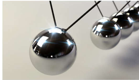
Impulsberatung im Rahmen der Wirtschaftsinitiative Nachhaltige Steiermark - WIN